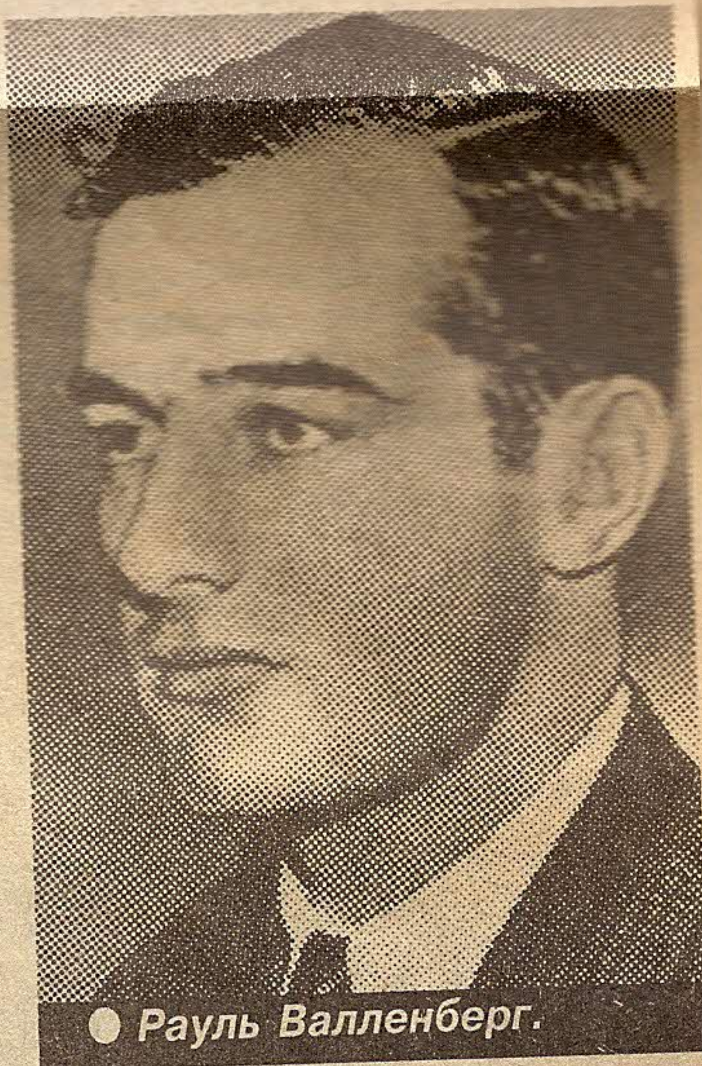
● Рауль Валленберг.

— Поиски в архиве Владимирской тюрьмы и Особом архиве, где работали независимые эксперты, были не напрасными, — говорит мой собеседник. — Вмес-